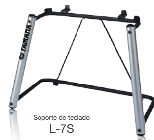
Soporte de teclado L-7S