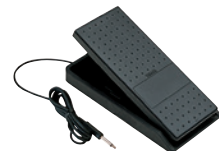
Controlador de pedal FC7