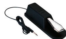
Interruptor de pedal FC4