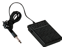
Interruptor de pedal FC5