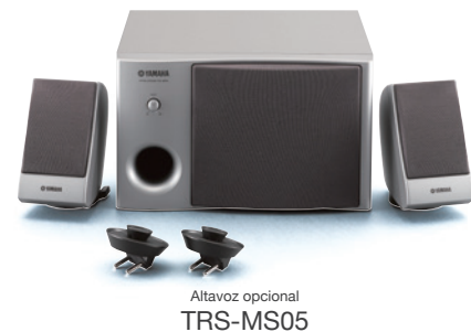
Altavoz opcional TRS-MS05