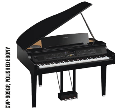
CVP-909GP, POLISHED EBONY

Les points en violet indiquent les caractéristiques supérieures ou supplémentaires par rapport au CVP-905.