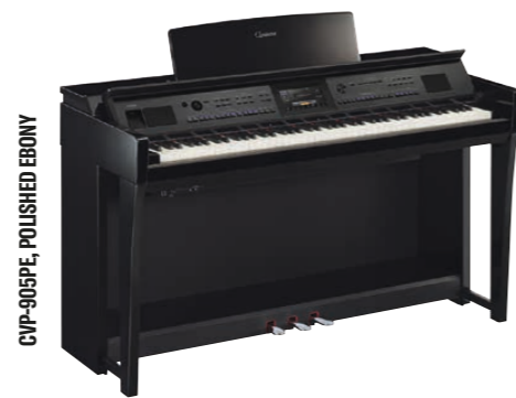
CVP-905PE, POLISHED EBONY