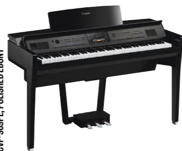
CVP-909PE, POLISHED EBONY